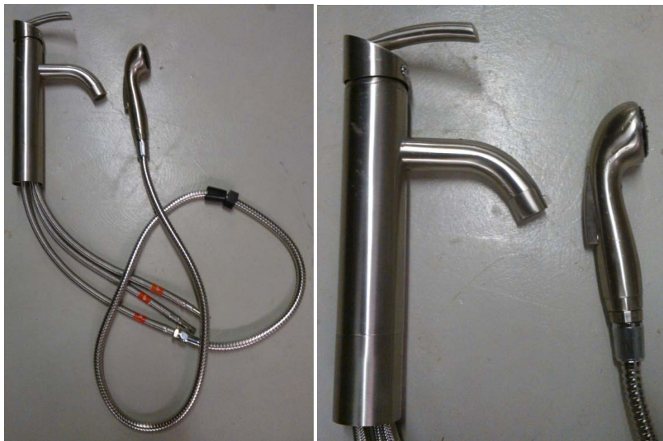
Kuva 1. Mitattu pesuallashana 10309 bide.