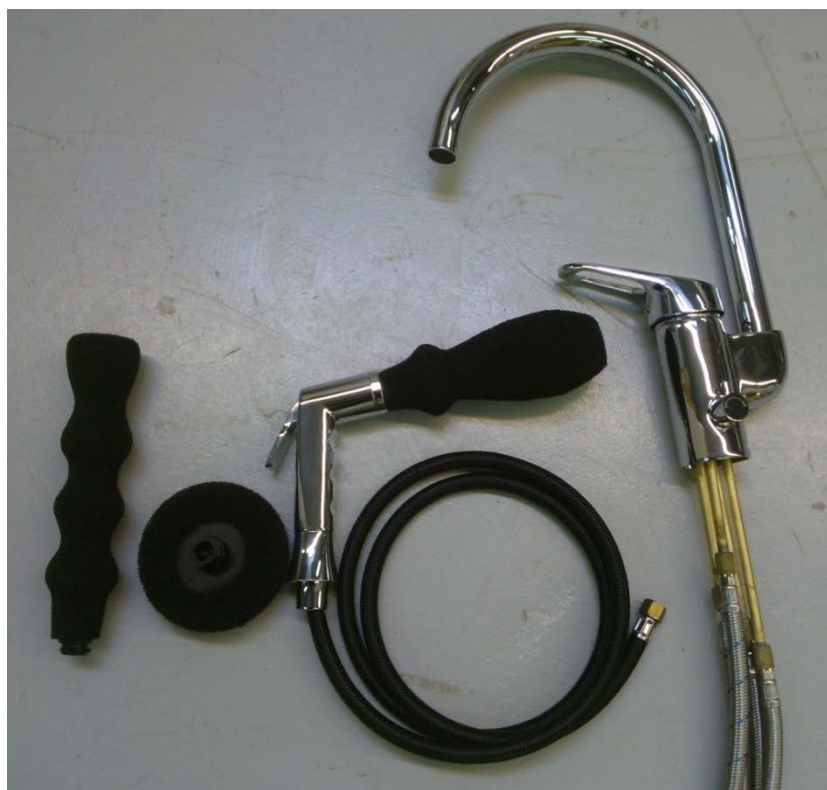
Kuva 1. Mitattu keittiöhana 10145 APK/PK sivusuihkulla.