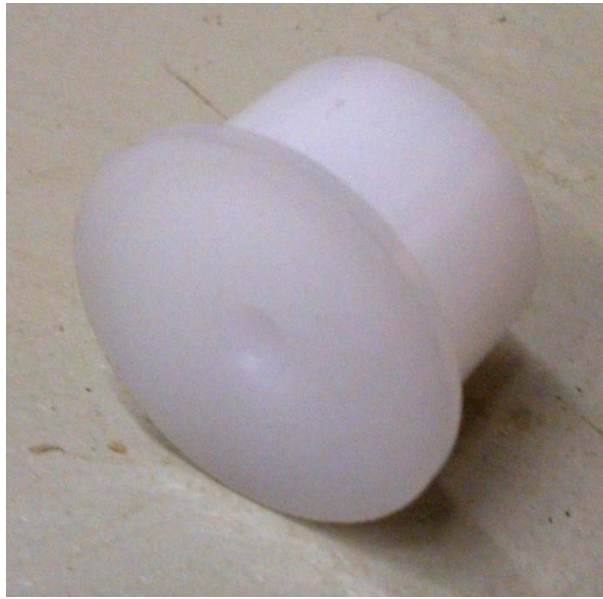
APK-liitännässä käytetty äänenvaimennin/virtauksenrajoitin.