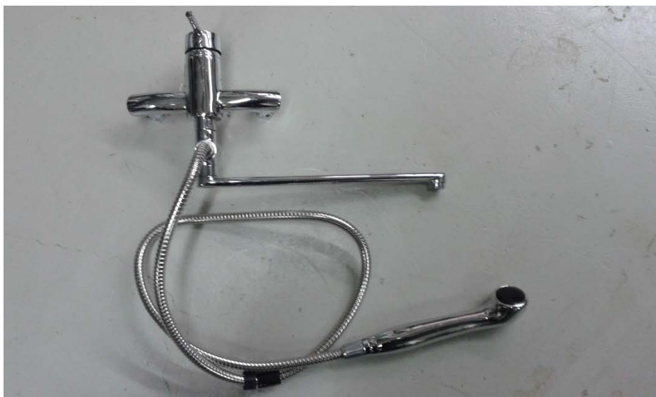
Kuva 1. Mitattu suihkuhana 10517 sekä käsisuihkuosa.